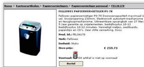
Voorbeeld van artikeldetailkaart

om artikelen aan een hoofdartikel te koppelen zodat u de variaties (bijvoorbeeld kleuren en maten) van een artikel in een lijst onder het hoofdartikel kunt tonen. De afbeeldingen van een artikel kunnen op diverse manieren binnen Store4U gekoppeld worden. Ze worden gesynchroniseerd wanneer deze in uw ERP systeem voorhanden zijn, ze kunnen zich in een directory op uw systeem bevinden en het is zelfs mogelijk om een artikel via een URL te laten verwijzen naar een afbeelding elders op het internet. De afbeeldingen worden automatisch verkleind naar het gewenste formaat.