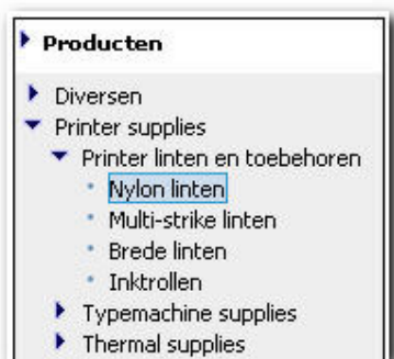
Voorbeeld HGS structuur.

artikelnavigatie in het middenschermbestuur wordt gebruikt. Verder is het mogelijk om uitgebreid te zoeken, hier kan de gebruiker een woord of een deel van het artikelnummer invoeren om snel de juiste artikelen te vinden. Filteren op merk is ook mogelijk. Er worden dan uitsluitend de artikelen getoond van een bepaald merk. Al deze extra kenmerken worden in uw ERP systeem aan een artikel toegevoegd en middels een standaard Orbis taak gesynchroniseerd met de database van Store4U.